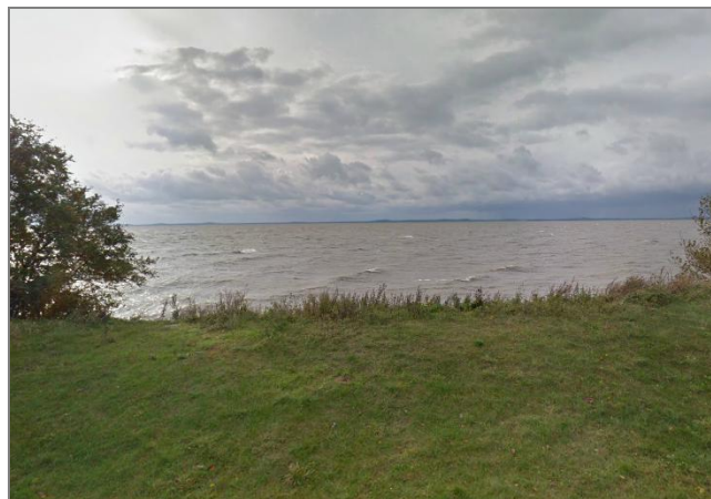
2 pav. Atviros erdvės į Kuršių marias Kuršių nerijos NP (kairėje) ir Nemuno deltos RP (dešinėje) Fig. 2. Open spaces in the Curonian lagoon of the Curonian Spit NP (left) and the Nemunas delta RP (right)