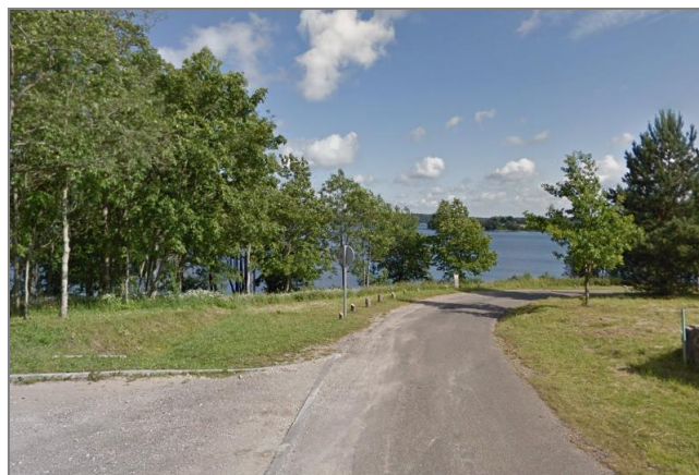
3 pav. Atviros erdvės Pajūrio RP (kairėje) ir Žemaitijos NP (dešinėje) Fig. 3. Open spaces in the Pajūris RP (left) and Zemaitija NA (right)