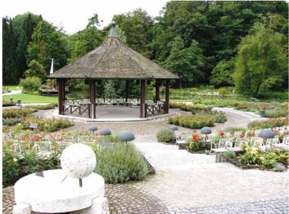
13 pav. Augsburgo botanikos sodo „žaliosios auditorijos“ mažoji architektūra Nekrošienė Rita. Gamtamoksliniam ugdymui pritaikyta mažoji architektūra pietų Vokietijos botanikos soduose Fig. 13. The small architecture in “green classes” in Augsburg Botanical garden Nekrošienė Rita. Small Architecture for Natural Science Activities in South Germany Botanical Gardens