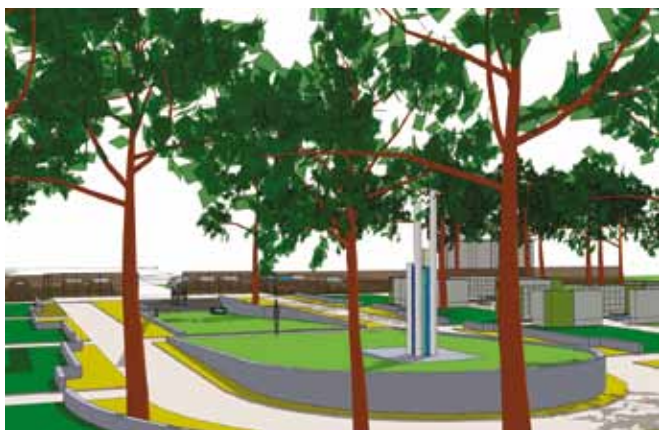
8 карт. Визуализация центральной части Колумбария в Риге Gundega Linare, Marina Jurkane. Традиции зелёной архитектуры кладбищ и мемориальных ансамблей Латвии Fig. 8. Visualization of the central part of Columbarium in Riga Gundega Linare, Marina Jurkane. Green Architecture Traditions of Latvian Cemeteries and Memorial Complexes