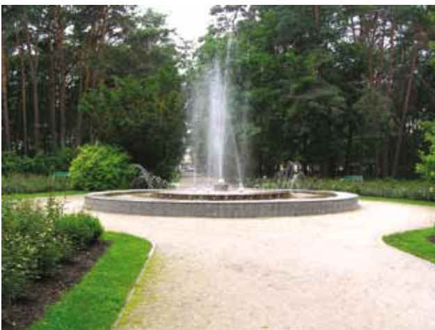
3 pav. Centrinė erdvė su fontanu ir gėlynais Alytaus miesto parke