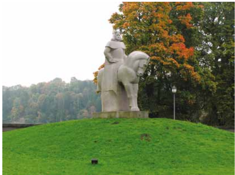
2 pav. Didžiojo kunigaikščio Vytauto paminklas Birštono parke