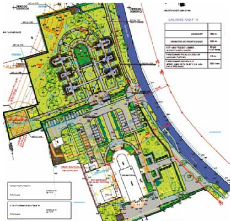
7 карт. Эскизный проект Колумбария в Риге.

Green Architecture Traditions of Latvian Cemeteries and Memorial Complexes