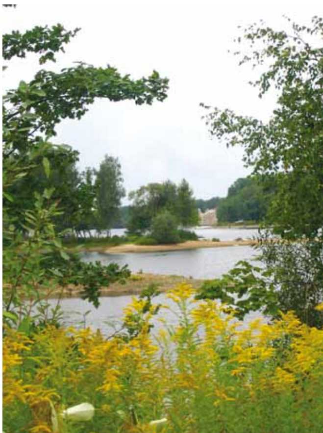
10 карт. Вид из мемориала „Криевкална сала“ на замковые руины Кокнесе Gundega Linare, Marina Jurkane. Традиции зелёной архитектуры кладбищ и мемориальных ансамблей Латвии Fig. 10. The View from the Memorial „Krievkalna sala“ to castle ruins in Koknese Gundega Linare, Marina Jurkane. Green Architecture Traditions of Latvian Cemeteries and Memorial Complexes