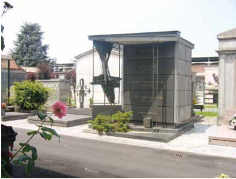
5 карт. Современный дизайн каплицы в Турине Gundega Linare, Marina Jurkane.

Традиции зелёной архитектуры кладбищ и мемориальных ансамблей Латвии