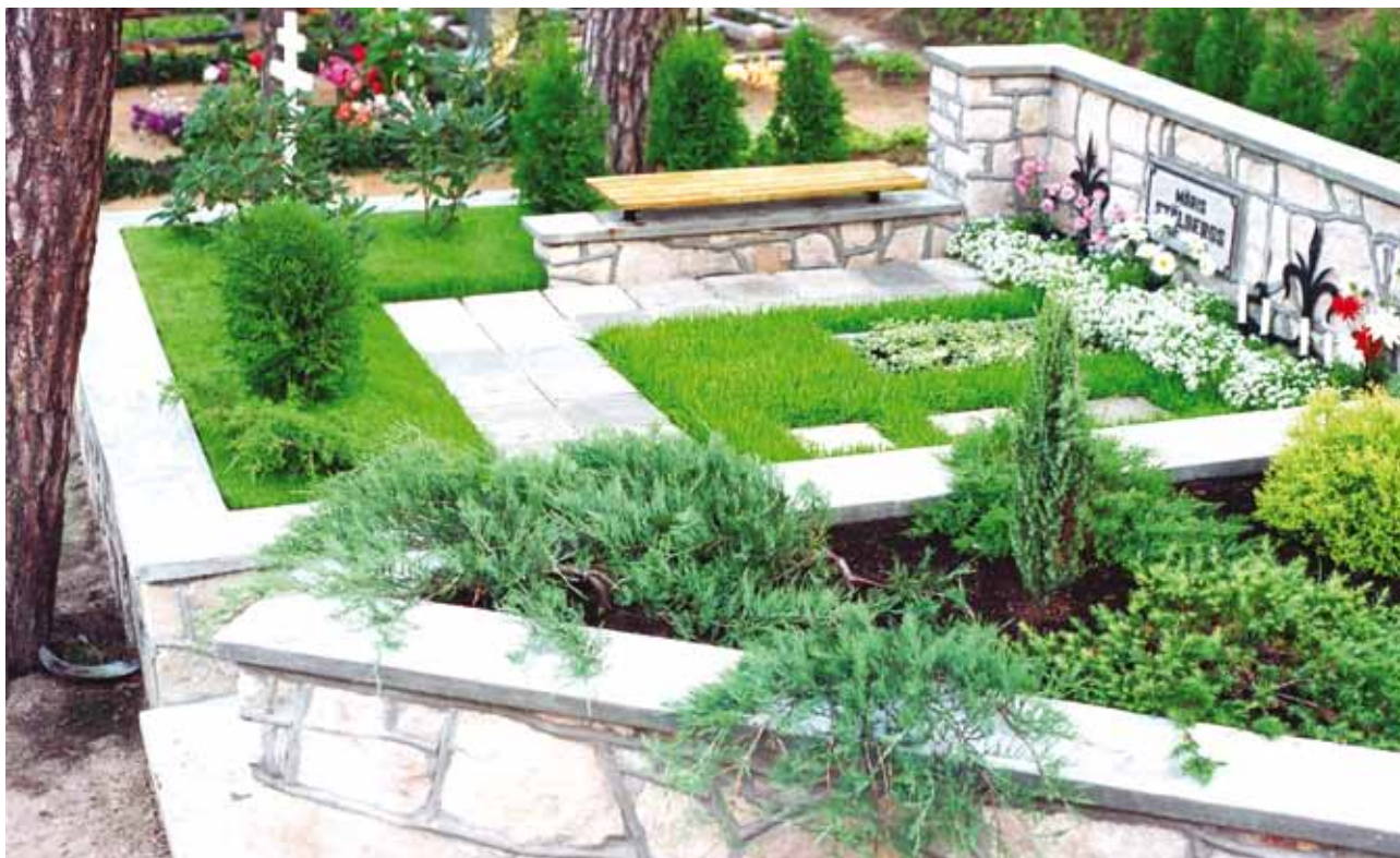
11 карт. Индивидуальное место захоронения в Риге. Автор - Г. Линарэ Gundega Linare, Marina Jurkane. Традиции зелёной архитектуры кладбищ и мемориальных ансамблей Латвии Fig. 11. Individual burial place in Riga. Author - G. Linare Gundega Linare, Marina Jurkane. Green Architecture Traditions of Latvian Cemeteries and Memorial Complexes