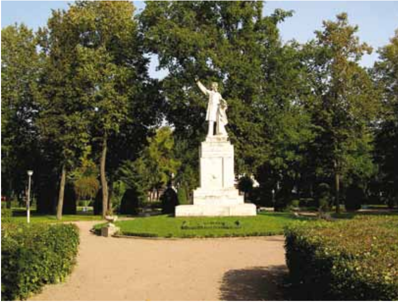
1 pav. Paminklas V. Kudirkai Kudirkos Naumiesčio „Varpo“ aikštės skvere