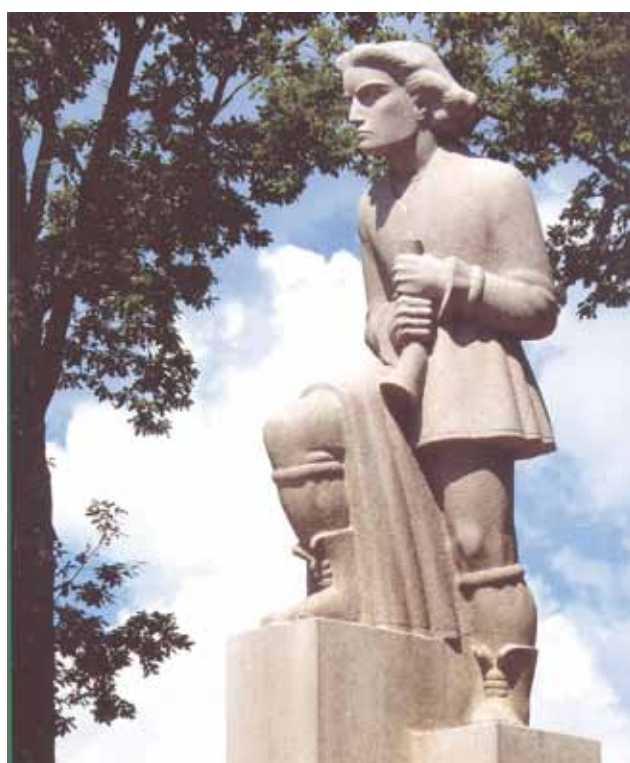
Seeking for Synthesis and Harmony of Sculptures in the Space of Green Plantings