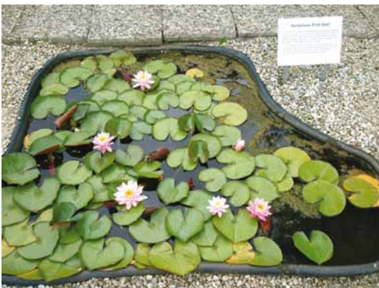
17 pav. Mažose talpose auginamos miniatiūrinės vandens lelijos ( Nymphaea 'Pink Opal' ir kt.) Regina Repšienė, Diana Baravykaitė. Mažose talpose tinkamų auginti vandens augalų įvairovė Libereco botanikos sode Fig. 17 Miniature waterlily lilies as Nymphaea 'Pink Opal' are suitable for growing in small containers Regina Repšienė, Diana Baravykaitė. A Diversity of Aquatic Plants Suitable for Small Containers in Liberec Botanical Garden