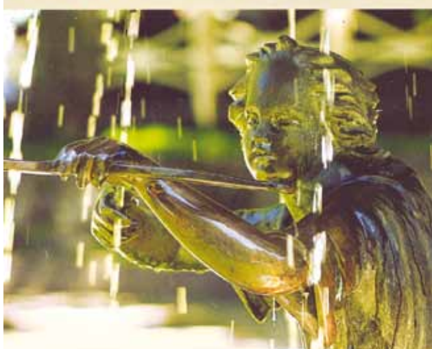
21 pav. Meno kūrinys su fontanu (Rundalės pils, Latvija, 2009) Aija Ziemeļniece. Siekiant skulptūros sintezės ir harmonijos žaliojoje erdvėje Fig. 21. A work of art with fountain. (Palace Rundale, Latvia, 2009) Aija Ziemeļniece. Seeking for Synthesis and Harmony of Sculptures in the Space of Green Plantings