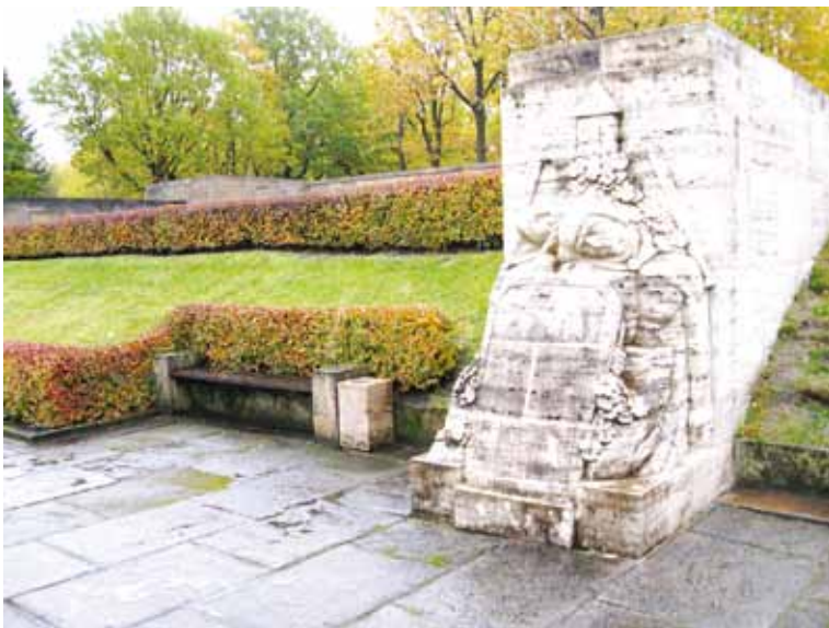
6 карт. Братское кладбище в Риге.

Green Architecture Traditions of Latvian Cemeteries and Memorial Complexes