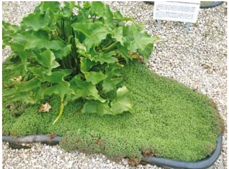
16 pav. Mažos talpos paviršių puikiai padengia Azolla caroliniana Lam. Regina Repšienė, Diana Baravykaitė. Mažose talpose tinkamų auginti vandens augalų įvairovė Libereco botanikos sode Fig. 16. Azolla caroliniana Lam. perfectly lay out on the surface of small container Regina Repšienė, Diana Baravykaitė. A Diversity of Aquatic Plants Suitable for Small Containers in Liberec Botanical Garden