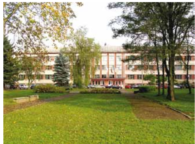
4 pav. Alytaus kolegijos parko centrinė dalis